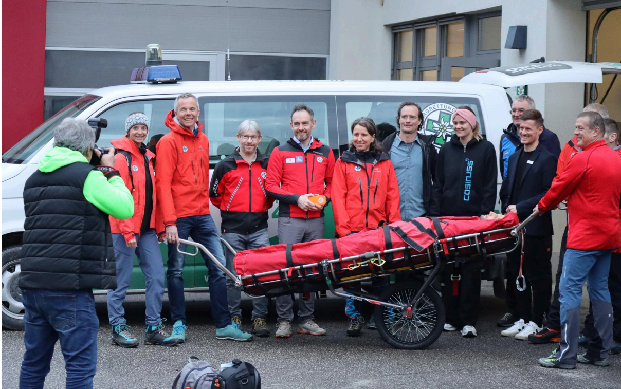
Übergabe-Event mit dem Österreichischen Bergrettungsdienst Bundesverband und den Bergbahnen Feuerkogel, ein Standort der Bergbahnen Dachstein Salzkammergut.